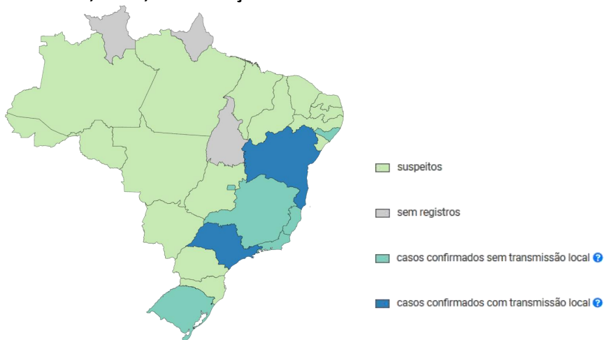
Figura 1. Unidades da Federação com casos notificados segundo o Ministério da Saúde, Brasil, 09 de março de 2020*

*Os dados serão atualizados após publicação de novo boletim pelo MS.